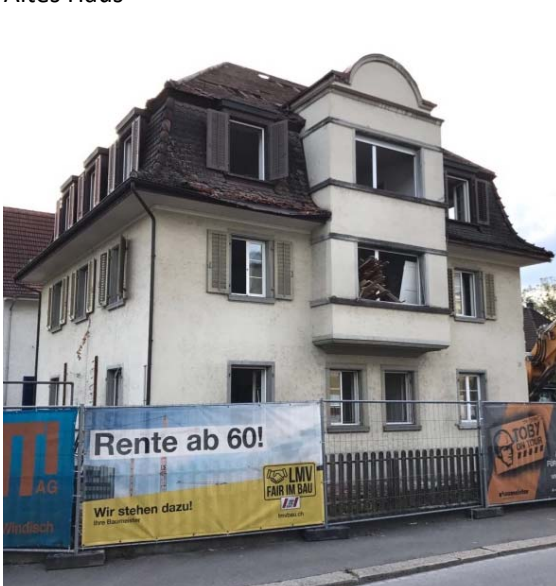
Abriss des alten Hauses